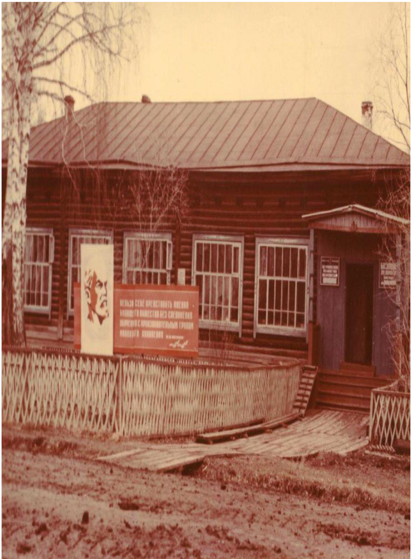
Берлинская восьмилетняя школа