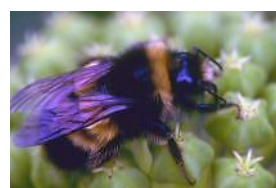
шмель 2 см