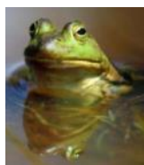
лягушка 10 см

Задание 4. Сравни размеры животных. Определи, кто всех длиннее .