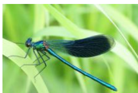
стрекоза 4 см